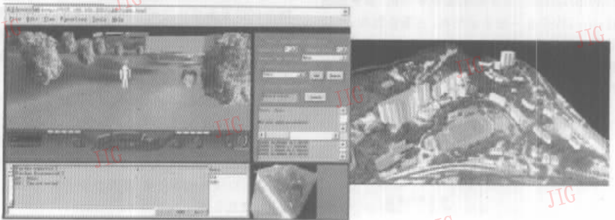
图3 虚拟香港中文大学

应用客户端/服务器结构、VRML 和 Java 以及 HTTP 协议,设计开发了虚拟香港中文大学(图3).图3左图表示虚拟中文大学的系统界面,右图是虚拟中文大学崇基学院的三维全景图.左图左上角是三维世界浏览窗口,其中的两个化身表示在线用户;左图右上角是用于参数选择、数据库查询、地理坐标量测、三维对象增加或删除等操作的菜单;左图左下角是用户间互相交流的文本对话窗口;左图右下角是对应于三维世界的二维图,用于选择区域或作三维导航.应该指出,应用客户端/服务器结构以及传统的 HTTP 协议模式开发的 Geo-DVE,在处理大数据量、极大在线用户量、以及多媒体尤其是声音和视像信息资料时,在支持快速实时的网络通信以及交互能力上有局限性.所以,必须研究和采用新的网络通信结构和新的面向分布式虚拟环境的网络协